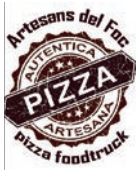
ARTESANS DEL FOC Pizzas artesanas al horno de leña