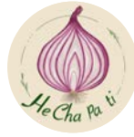
HECHA PA TI Cocina vegetariana y vegana