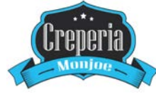
CREPERIA Creps dulces y saladas